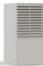
NEBBIA (RAL 9018)