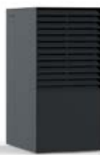
ANTHRACITE (RAL 7016)