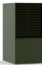
OLIO (RAL 6003)