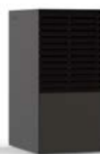
NERO (RAL 8019)